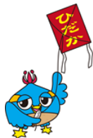
日高市マスコットキャラクター 「くりっぴー」