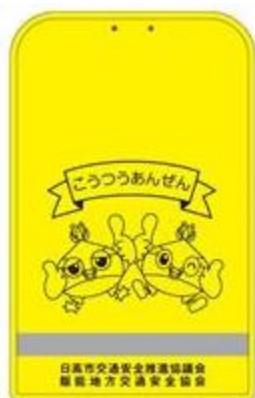
ランドセルカバー