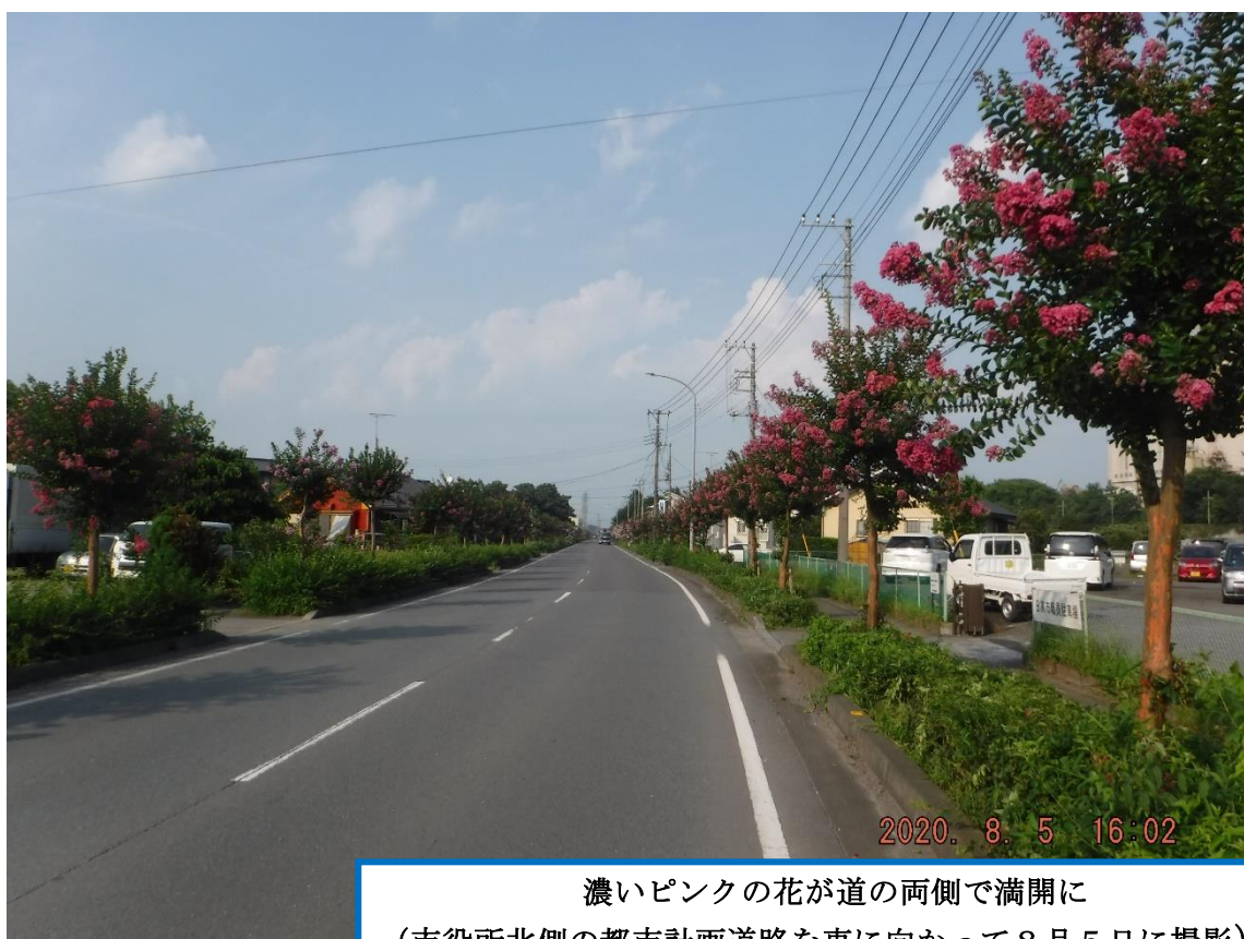
濃いピンクの花が道の両側で満開に (市役所北側の都市計画道路を東に向かって8月5日に撮影)

濃いピンク、薄いピンク、紅色や白色、薄紫色の花が風に揺れています。見頃は9月中旬頃まで続きます。夏に咲く貴重な花、百日紅（サルスベリ）をご覧ください。