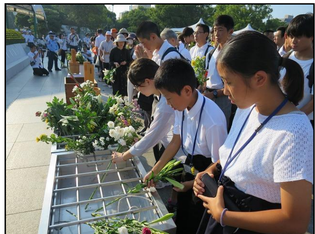
昨年度の児童派遣の様子