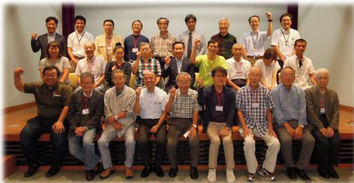
第4回市民ワークショップ終了後の参加者合同撮影