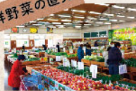
あくれっしゅ日高中央直売所・高萩南農産物直売所