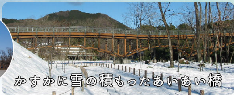
かすかに雪の積もったあいあい橋