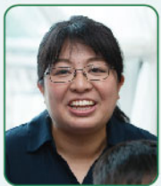
ゆったりとした時間が過ごせるのも日高ならでは

していく中で、子どもたちが巣立っていったも夫婦お互いのコミュニティがあるから寂しさを感じなくて済みそうです。