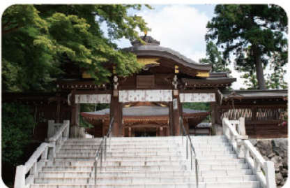
高麗神社 | こまじんじゃ ▶ マップ 25

高麗川はバーベキューの人気スポットで、夏には水遊びも楽しめます。川のせせらぎを感じながら、家族や友人とのんびり過ごせる贅沢な時間。水のきれいなところに住み、鮮やかなコバルトブルーの色をした日高市シンボルの鳥「カワセミ」が生息しています。