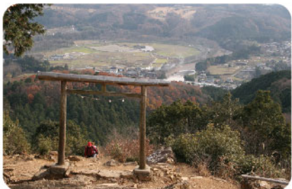
日和田山 | ひわたさん ▶ マップ 26

標高が305mと、初心者や親子でも気軽に登山が楽しめます。スリリングな岩登りができる男坂と、ゆるやかな山道を進む女坂に分かれており、何度も楽しめるのがコースの特徴。天気が良ければ東京スカイツリーが見えることもある、絶景スポットです。