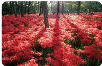
巾着田 | きんちやくだ ▶ マップ 24

高麗川が蛇行し、その形が巾着に似ていることから巾着田と呼ばれています。川に囲まれた平地には菜の花やコスモスなどの花々が咲き、四季折々の景色を楽しめます。中でも秋の曼珠沙華群生地は辺り一面が真紅に染まり、まるで赤いじゅうたんを敷き詰めたような美しさを目の当たりにできます。