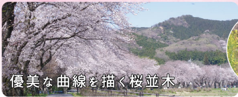
優美な曲線を描く桜並木