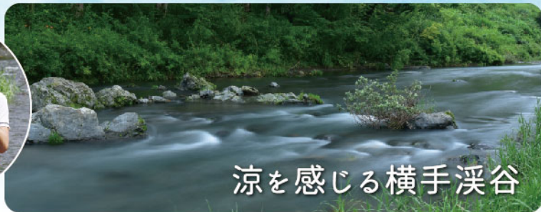
涼を感じる横手渓谷