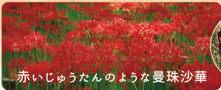
赤いじゅうたんのような曼珠沙華