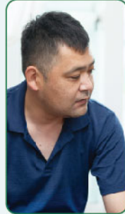
お父さんネットワークが地域に溶け込むきっかけに