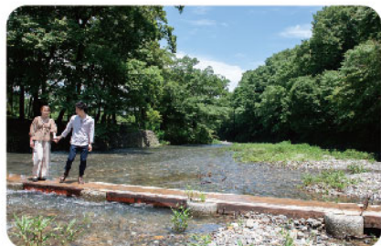
高麗川 | こまがわ

標高が305mと、初心者や親子でも気軽に登山が楽しめます。スリリングな岩登りができる男坂と、ゆるやかな山道を進む女坂に分かれており、何度も楽しめるのがコースの特徴。天気が良ければ東京スカイツリーが見えることもある、絶景スポットです。