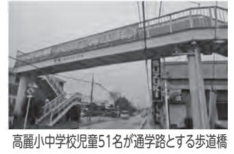
高麗小中学校児童51名が通学路とする歩道橋

【答】 多角的検証と安全性・地域保護者の意見を伺い慎重に検討し適切に設定を行う。