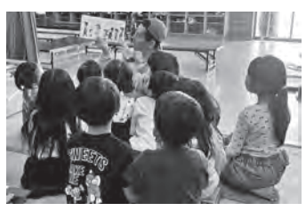
学童保育室で読み聞かせ中の指導員と子ども達

答 令和8年度から高麗川かえで学童保育室の支援単位を1つ追加し、3単位の支援数とする。