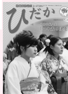
平成29年2月 第96号新デザイン