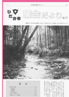
平成6年5月 第11号A4サイズに