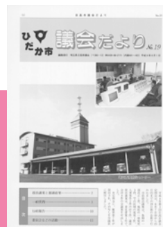
平成8年8月 第19号新デザイン