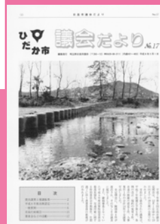
平成8年2月 第17号カラーに