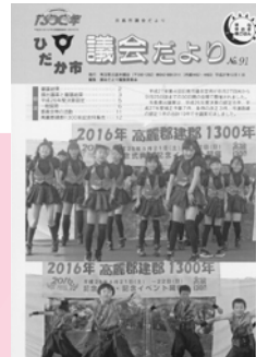
平成27年12月 第91号新デザイン