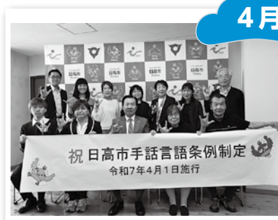
▲日高市手話言語条例の制定