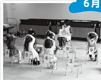
▲5歳児健康診査を開始