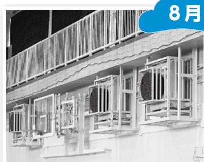
▲全ての市立学校体育館へ 空調設備を新設