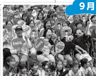
▲東京2025世界陸上 パブリックビューイングの開催