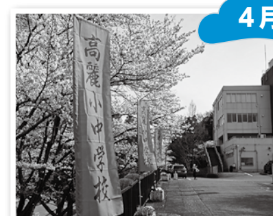
▲義務教育学校高麗小中学校の開校