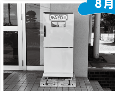
▲AED屋外収納ボックスの設置