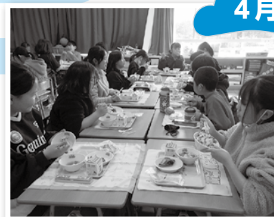
▲学校給食費の無償化を開始