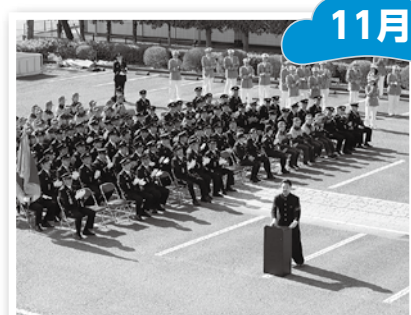
▲令和7年度日高市消防団特別点検および 日高市消防団設立70周年記念事業