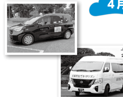
▲おでかけタクシーおよび おでかけワゴンの運行を開始