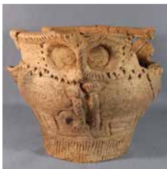
▲勝坂Ⅲ式土器(縄文時代中期中葉 約4,500年前)明婦遺跡出土(鹿山)

生涯学習センターの南側、小畔川左岸に広がる遺跡の住居跡の炉で使用されていた深鉢形土器です。粘土紐を立体的に貼り付けた造形は「フクロウ」に見えませんか？