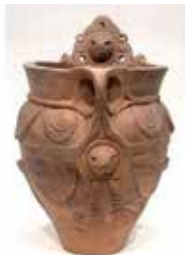
▶山梨県北杜市津金御所前遺跡出土深鉢

土器の口縁に付けられた顔面把手と、土器本体に描かれた人体のような文様と人面文様は、今まさに子どもが生まれ出る瞬間を表現していると考えられます。宿東遺跡出土の深鉢もこの土器と同様な文様構成となっています。