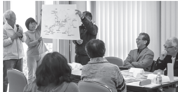
▲第1層協議体の様子(平成30年11月撮影)