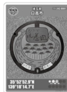
▲第2弾マンホールカード