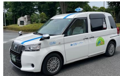
【おでかけタクシー車両】