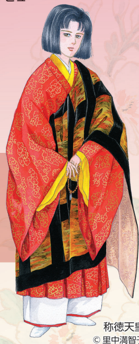
称徳天皇 ©里中満智子

500タイトル以上の作品を描き 2026年は画業62年となる。 代表作に「アリエスの乙女たち」「あかね雲」「海のオーロラ」「あすなろ坂」「天上の虹」「女帝の手記」「アトンの娘」「マンガギリシャ神話」など。 1998年刊行の「女帝の手記」は、阿倍内親王(孝謙・称徳天皇)を主人公に描いた作品。阿倍内親王は高麗福信が生涯を通して仕えた天皇です。