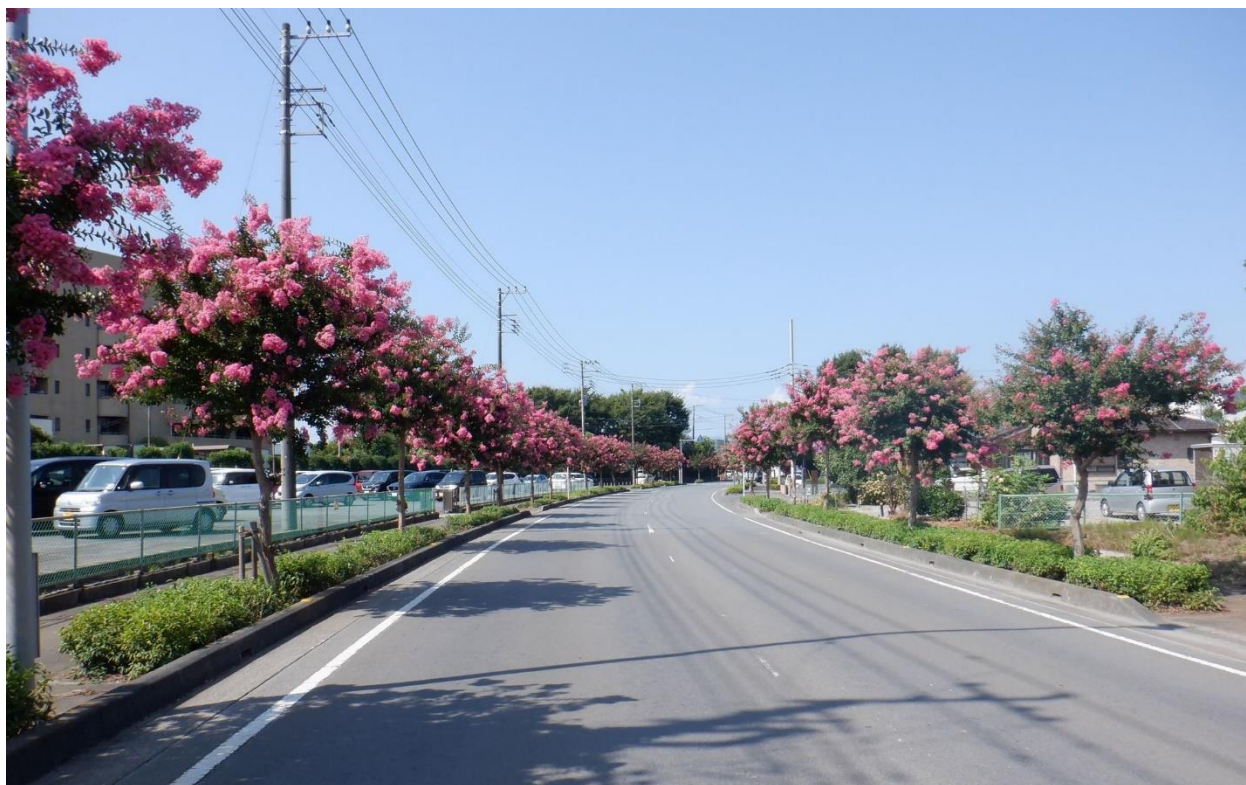
ピンクの花が道の両側で満開に (市役所北側の都市計画道路にて 8月4日撮影)

見頃は9月中旬まで続きます。安全に注意しながら、車窓からの眺めをお楽しみください。