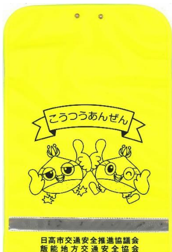
▲ランドセルカバー

出席者(予定) 飯能地方交通安全協会副会長、日高市交通安全母の会会長、日高市教育長、飯能警察署長