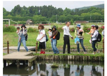
5/16 親子ハッピーたいむ お弁当持って巾着田へ♪