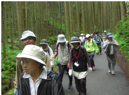
5/17 定例ウォーキング 小瀬名から北向き地蔵を歩く