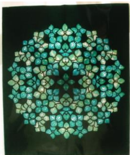
5月 3回講座 ペーパーステンドグラス 「花束」教室