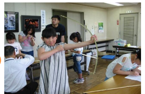
5/8 子ども公民館 弓矢を作ったよ！！