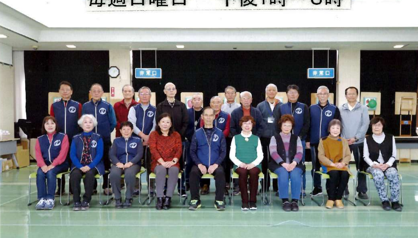
ひだかかわせみ支部 初吹き会 令和6年1月10日