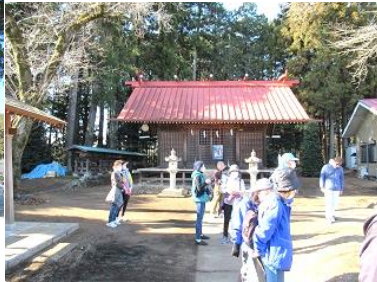
↑ 定例健幸ウォーキングで毎年恒例の「新春寺社めぐり」♪

→ 青少年相談員主催イベントで、お兄さん・お姉さんたちと一緒に、子供たちが餅つきをしているところにお邪魔してパシャリ☆