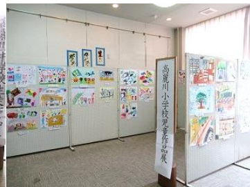
↑ 高麗川中学生と高麗川小児童の作品展がありました☆