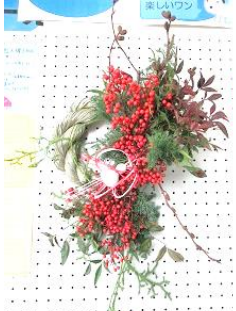
↑「お正月飾り」とっても立派なものが出来ました！