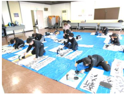
→「書き初め教室」みんな一生懸命書いてました！