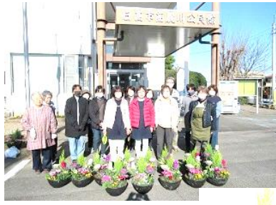
↑「初春を飾る寄せ植え教室」今年はゴールドクレストを入れてもらいました。