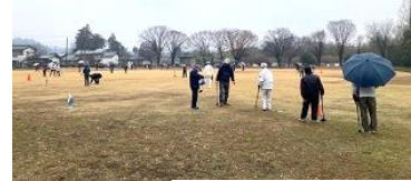
←「グランドゴルフ大会」を実施しました。雨の中、大変でしたね