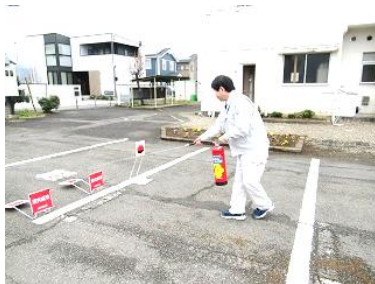
←「公民館自衛消防訓練」館長が水消火器訓練をおこなっているところをパシャリ☆