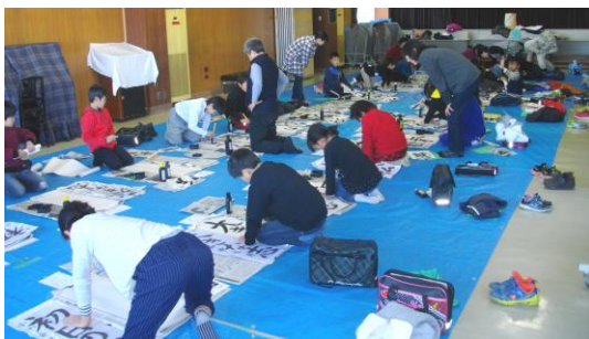
「書き初めの練習をしよう」(12月28日) 新年にむけてみんなで書き初めの練習をしました。