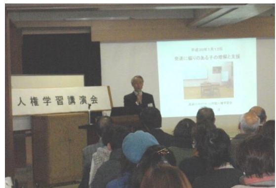
「人権学習講演会」(高萩小中PTA共催)(1月13日) 『発達に偏りのある子の理解と支援』について多くの方が学びました。