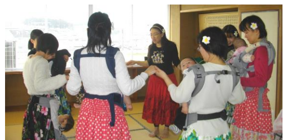
「赤ちゃん和フラダンス」(1月15日) お母さんたちが赤ちゃんをつれていっしょにフラダンス。