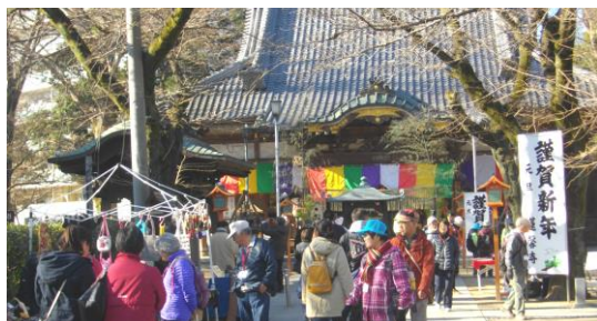
「定例健康ウォーキング」(1月6日) 新年の川越七福神めぐりを行いました。 蓮馨寺でパシャリ。