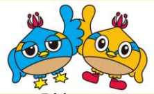
日高市マスコット くりっかー・くりっぴー

NO. 305 令和2年12月1日発行：高萩北公民館 旭ヶ丘997-1 TEL 042(989)7322 FAX 042(989)9948