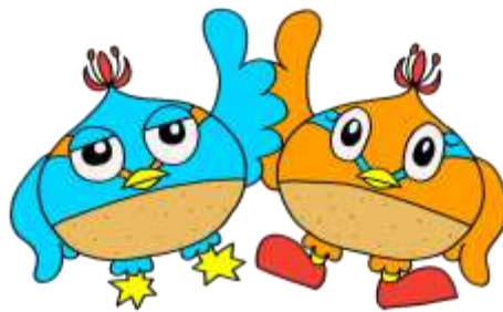
市のマスコットキャラクター くりっかー&くりっぴー