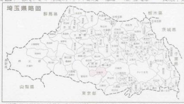
日高公共下水道計画諸元表