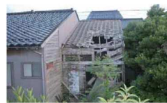
③屋根の落下、落ち込み