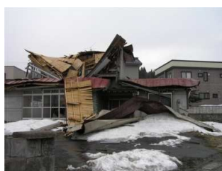
①屋根が落下した空き家