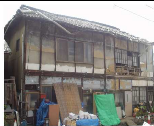
②雨樋の著しい変形