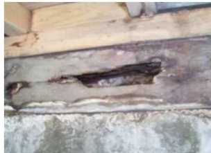
⑤土台に蟻害が発生