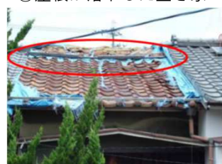
④屋根ふき材に剥離、脱落