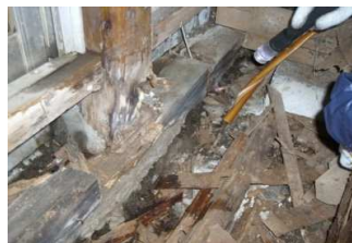
②湿気等が原因で床下腐朽