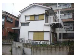
⑦基礎が大きく破損