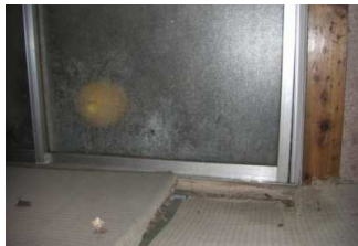
①床下の根太が折れ畳が陥没