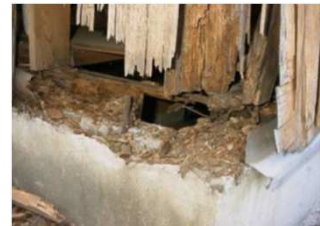
③蟻害が発生し欠損