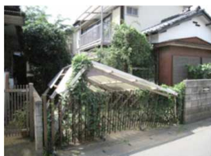
④カーポートの崩落