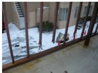
②バルコニー手すりが腐食