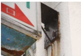
①支持部分に著しい腐食