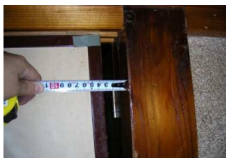
①柱の傾斜で襖が閉まらない