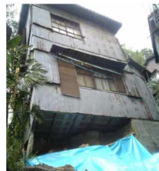
③基礎が大きく欠損