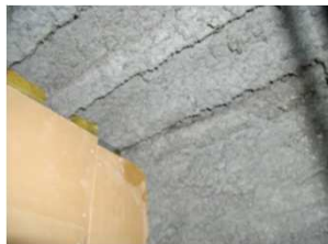
①②吹付け石綿等が飛散し暴露する可能性が高い

写真出典：写真①② 国土交通省「既存不適格建築物に係る是正命令制度に関するガイドライン」