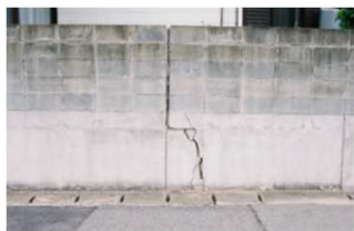
①塀に大きなひび割れ