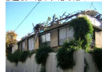
⑥屋根ふき材の破損