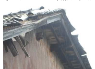
⑦屋根ふき材の破損