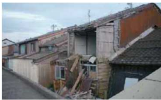
①壁体を貫通する穴