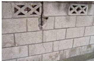
②塀に大きなひび割れ