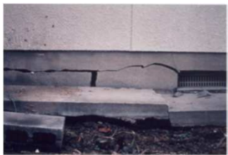
④基礎が大きく破損