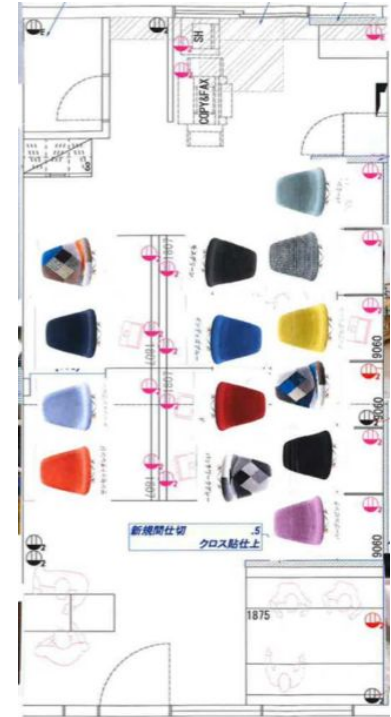
コワーキングスペースの平面図