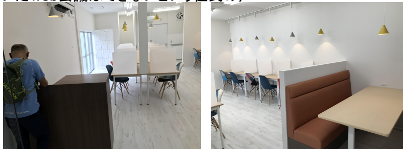
コワーキングスペースの内装