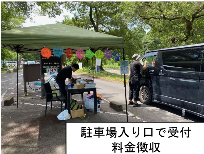
駐車場入り口で受付 料金徴収