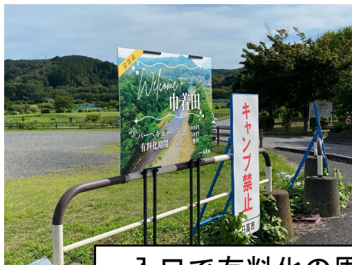
入口で有料化の周知