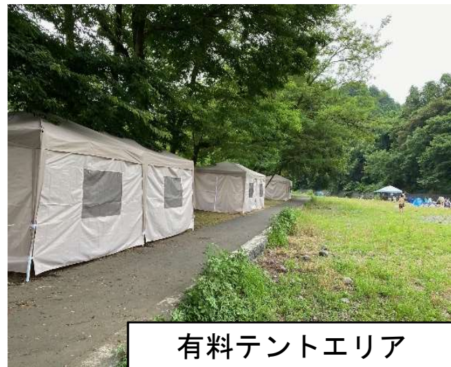
有料テントエリア