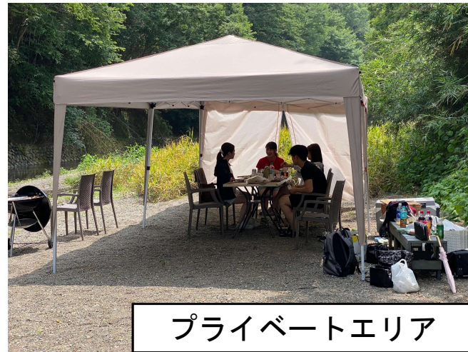
プライベートエリア