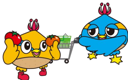
日高市マスコットキャラクター 「くりっかー・くりっぴー」