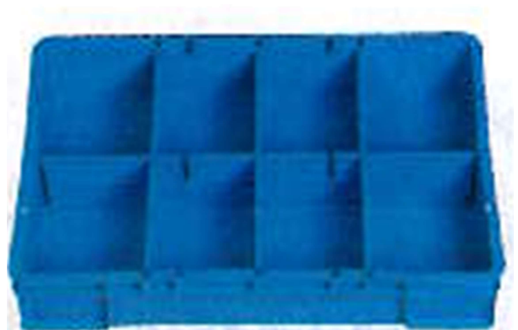
ボックス内に設置するトレイ ※仕切りあり（カタログより）