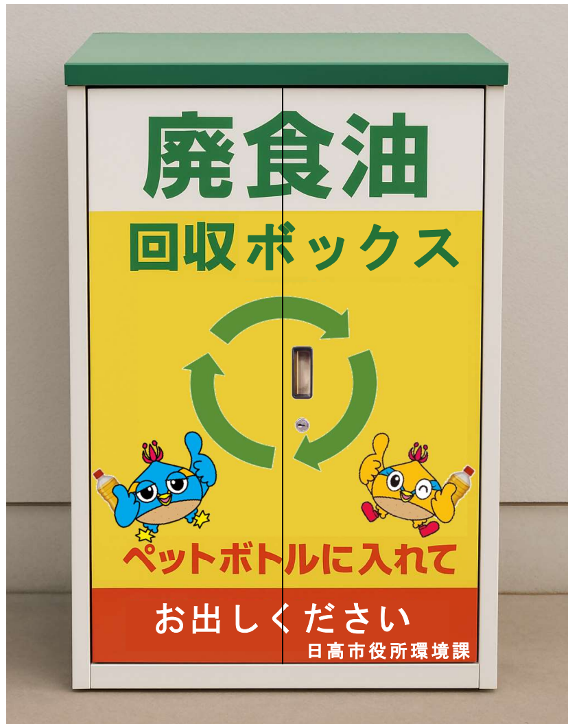
廃食油回収ボックス（イメージ）