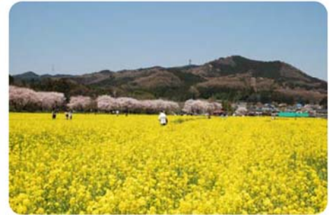
春の巾着田と日和田山

自然環境とは、動植物や生態系に関わることです。地域の豊かな自然の保全・創出などに関するような要素が含まれます。