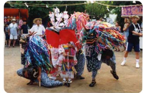
民俗文化財 高麗神社獅子舞

文化環境とは、生活にやすらぎと潤いを与える環境に関することです。市民が文化的で心地よく生活を送るための歴史や文化、景観、公園、都市の形成に関する要素が含まれます。