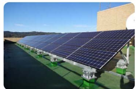
市役所屋上の太陽光パネル

地球環境とは、地域や国を超えたグローバルな視点に立った環境に関することです。廃棄物、エネルギー、地球温暖化など生活の身近な活動が与える地球への負荷などに関する要素が含まれます。