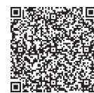
電子申請専用 QRコード