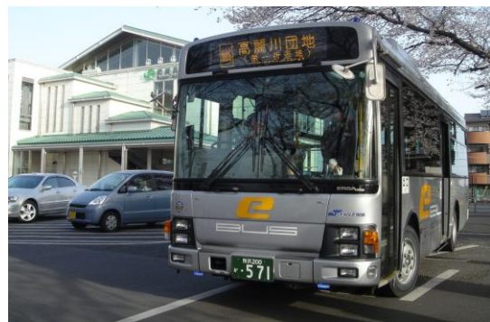
イーグルバス（主に市の東部を運行）