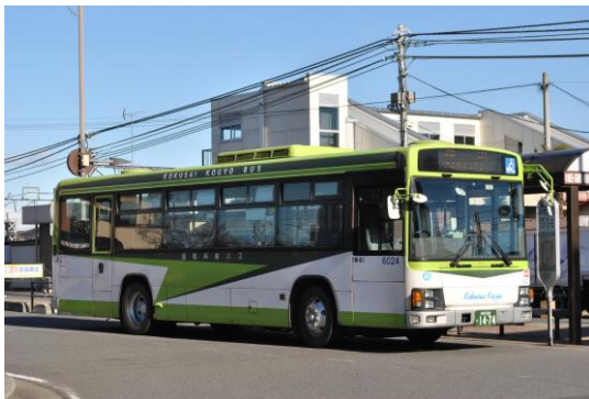
国際興業バス（主に市の西部を運行）