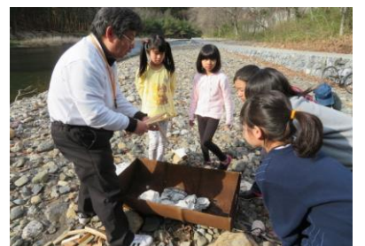
3/24春のキャンプだホイ