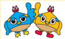
日高市マスコット くりっかー・くりっぴー