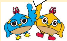
日高市マスコット くりっかー・くりっぴー